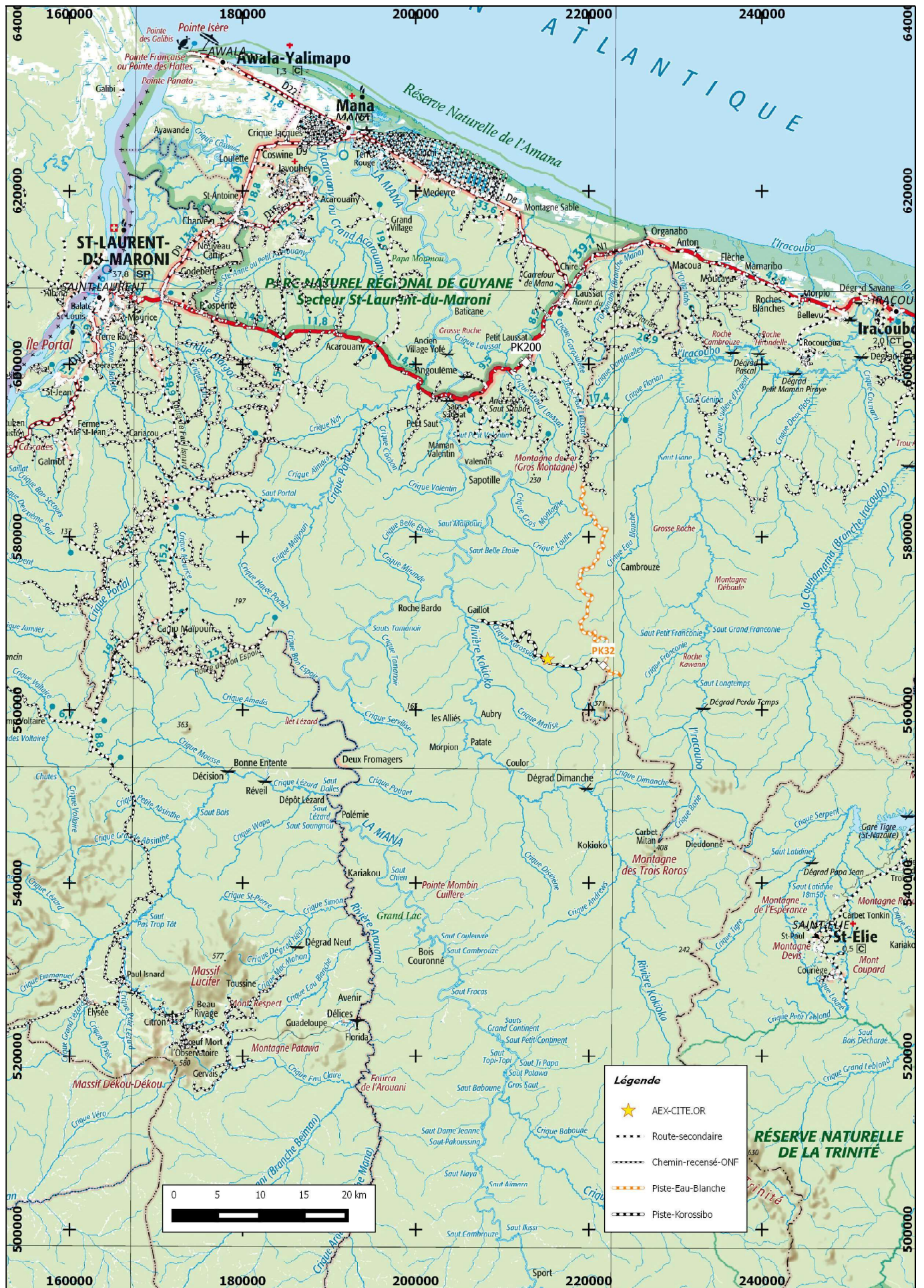
Schéma de pénétration du domaine forestier dans le cadre de l'AEX « crique Flora aval » de la SARL CITE'OR sur un fond de carte IGN au 1/500 000° en RGFG95 UTM22